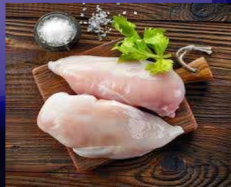
FILET DE POULET (1 OU 2)