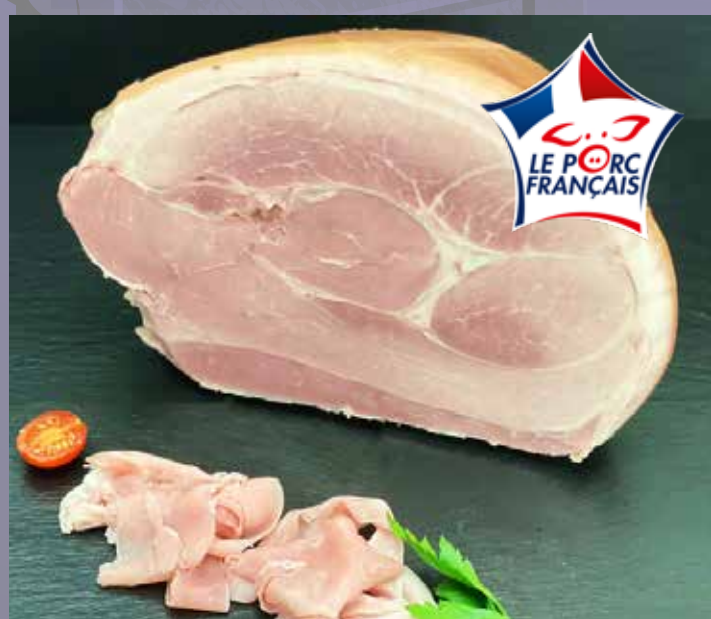
JAMBON SUPÉRIEUR À L'OS AVEC COUENNE (1)