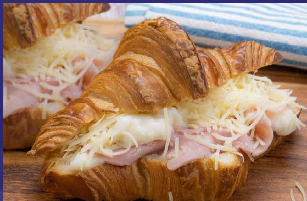
CROISSANT JAMBON / FROMAGE X6 (3)