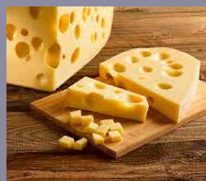
EMMENTAL FRANÇAIS (2)

Fromage au lait pasteurisé de vache 32% de Mat. Gr. sur produit fini