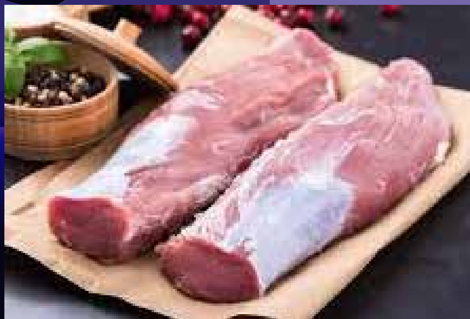
FILET MIGNON DE PORC (2)