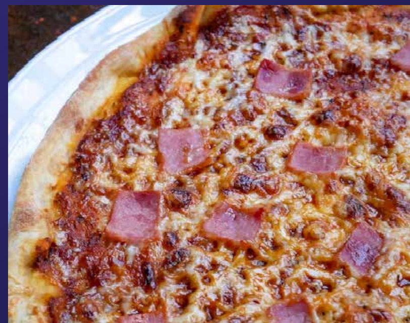
PIZZA JAMBON / FROMAGE (3)