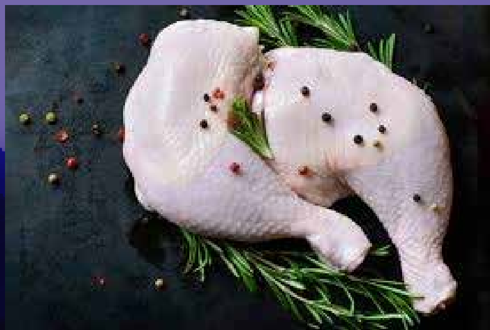
CUISSE DE POULET (1 OU 2)