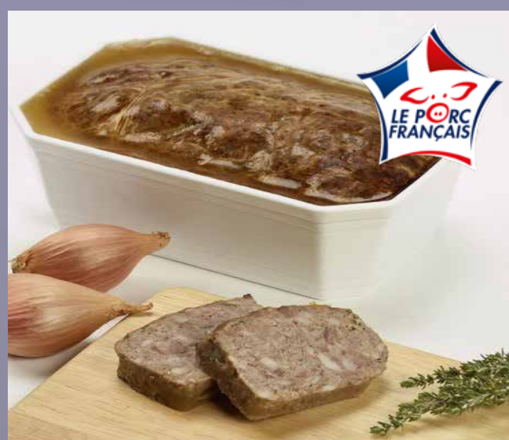
PATÉ DE CAMPAGNE (1)