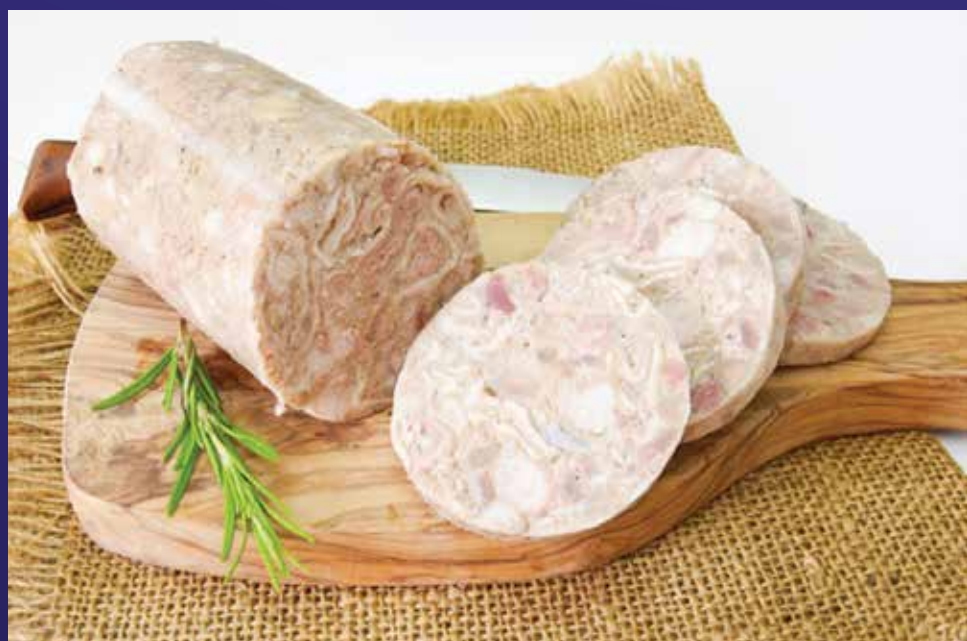
ANDOUILLE CRUE (3)